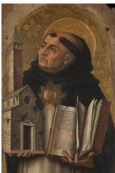
Maleri av Augustin, Carlo Crivelli, 1476

Thomas Aquinas (1225–1274) er den mest berømte kirkelæreren fra middelalderen. Han er kjent for at han videreutviklet Aristoteles' tanker i kristen retning, og for å ha smeltet sammen kristen lære og aristotelisk filosofi.